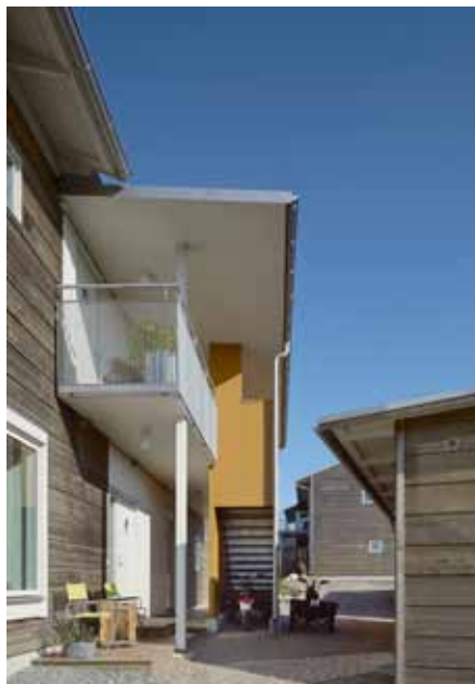
De boende älskar sina hus på den bilfria ön Brännö.

– Det gick trögare än jag trodde. Vi missbedömde marknaden.